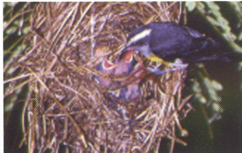
La reinita común ( Coereba flaveola )