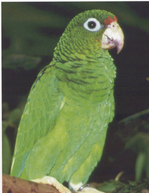
La cotorra puertorriqueña ( Amazona vittata ).

La región del karso posee la más alta biodiversidad en todo Puerto Rico. Más de 1,300 especies de plantas y animales están presentes en el karso. Es un hábitat excelente para la mayoría de las especies nativas y endémicas, incluyendo unas 30 especies en peligro de extinción. Muchas de estas especies sólo se encuentran en el ecosistema del karso puertorriqueño.