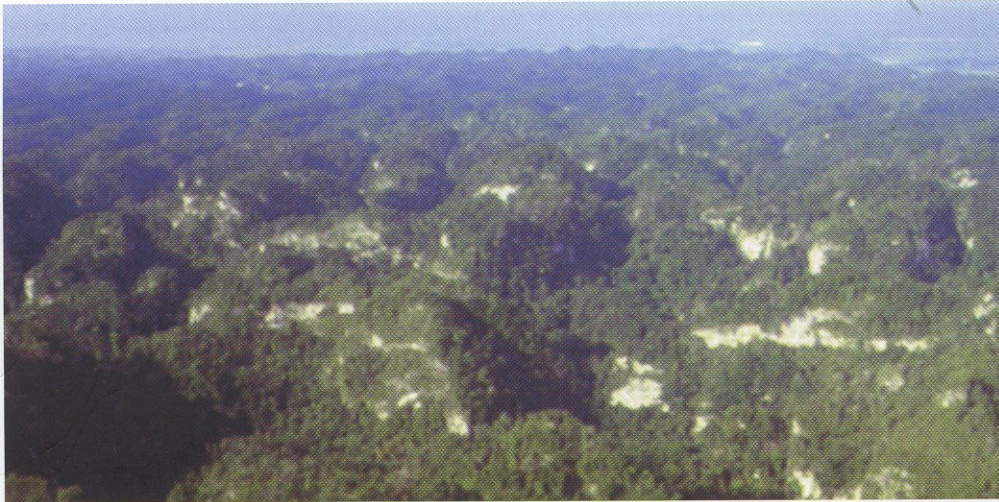
Mogotes del norte de Puerto Rico.

El karso puertorriqueño cubre más de una tercera parte del territorio isleño. El karso se divide en dos regiones mayores: el karso norteño, el cual está localizado en la zona de vida de bosque subtropical húmedo y el karso del sur, el cual se encuentra en la zona de bosque subtropical seco.