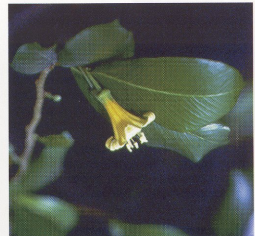
( Goetzea elegans , se encuentra en los mogotes)

población de cotorra puertorriqueña ( Amazona vittata ) y la protección de muchas otras especies en peligro de extinción.